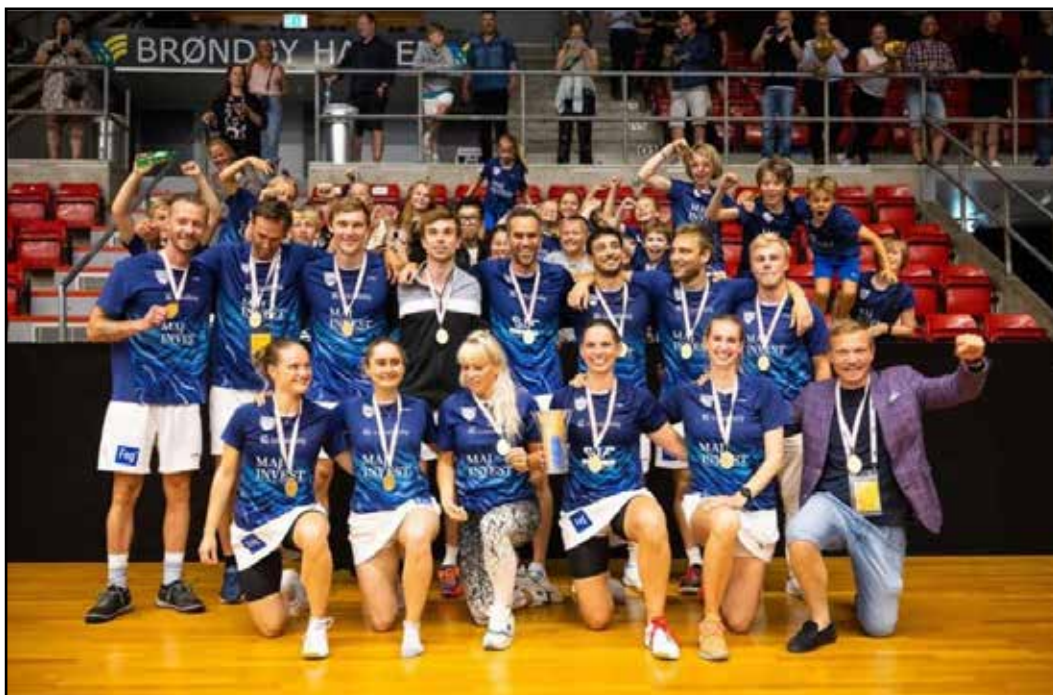
Sæsonen 2021 blev præget af Corona, men for Skovshoved blev det en stor triumf, da det lykkedes at vinde DM finalen i Brøndby Hallen.