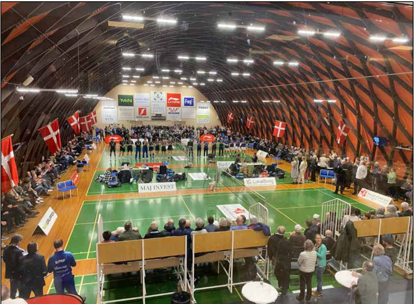
Så festligt kan det være, når der spilles badminton i Skovshoved Idrætsforening.