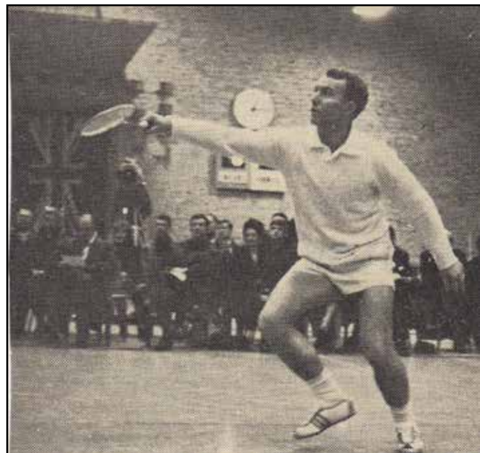
Grønært var ikke mindst kendt for en ukuelig fightervilje og en enorm træningsvilje, og så var han generelt et boldtalent.

-Jeg sagde til en af de spillere, der drillede mig mest – en gammel OL-deltager i boksning – at han kunne få 99 point forud, når vi spillede til 100. Og han måtte starte med at serve. Dengang skulle man jo først vinde serveretten for at score point. Der var mange tilskuere til den kamp i Valby en søndag formiddag klokken 10. Jeg vandt og min modstander måtte betale for to kasser øl. Jeg fik skabt respekt, og når jeg siden havde været ude at spille, blev