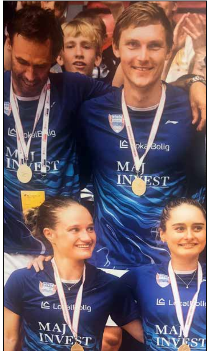
Viktor Axelsen kan blandt sine mange triumfer også føje et dansk holdmesterskab til de mange andre titler.

Viktor blev for nogle måneder opereret for en skade i ryggen og har valgt at holde en ekstraordinær lang pause for at være sikker på, at helbredet kan holde.