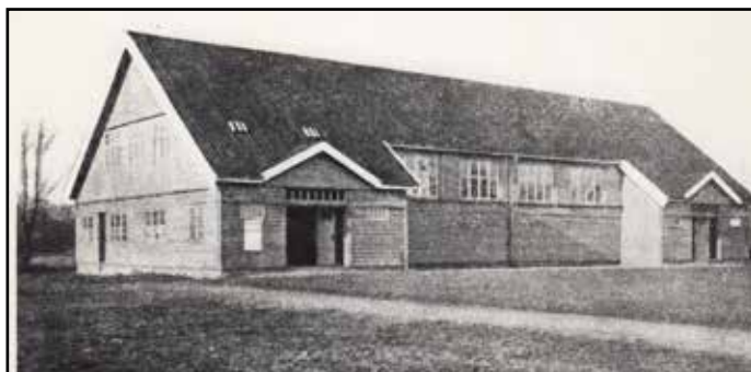
Skovshoved IF købte denne hal af AB i 1922. Den blev genopført og stod færdig i 1924, og året efter blev der for første gang spillet badminton i Danmark i denne hal.