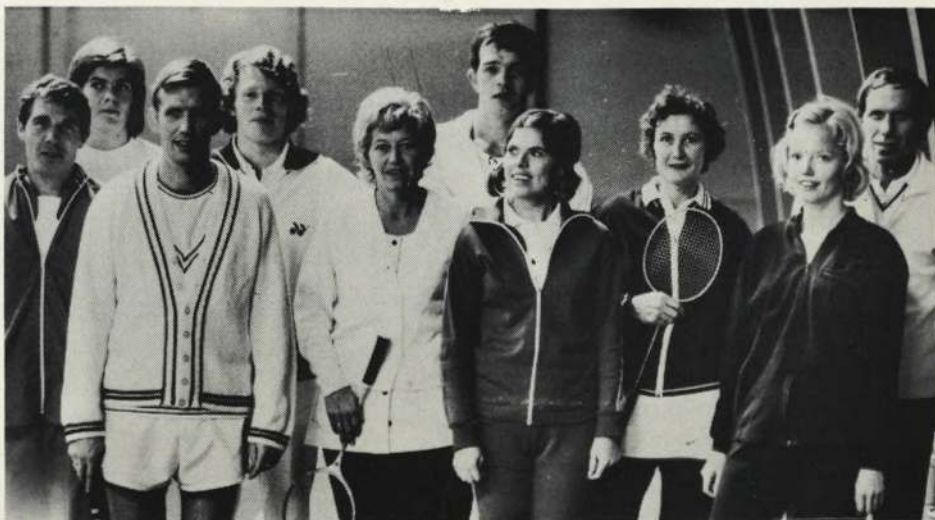
Bornholms samlede styrker fra Rønne er troppet op i Kastrup Magleby for at bære en sæk på 1-13 hjem. Men kom igen, Rønne!