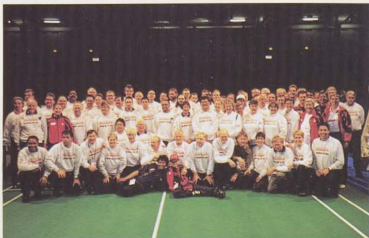
Hele det store korps af liniedommere under VM. Nu er chancen der for at få flere store badmintonoplevelser på linierne ved at melde sig til et nyt korps af liniedommere.