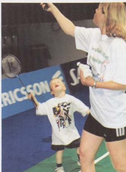
Ledere og trænere skal gå hjem fra Smash 2000 kurserne med fornyet inspiration til hverdagen i klubberne.

kontoret og sender alle invitationerne ud til klubberne, når hun