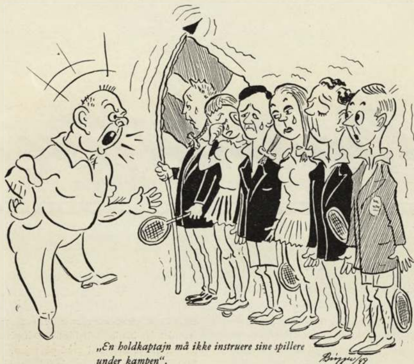
„En holdkaptajn må ikke instruere sine spillere under kampen“.

Der er ingen tvivl om, at der blandt danske badminton-interesserede (spillere såvel som ledere) savnes en klar opfattelse af begrebet »holdkaptajn« og dennes betydning; og da der netop i den senere tid i tale og skrift har været en del røre om spørgsmålet, synes jeg, at det er en god idé, at »Badminton« har ønsket at tage sagen op til behandling.